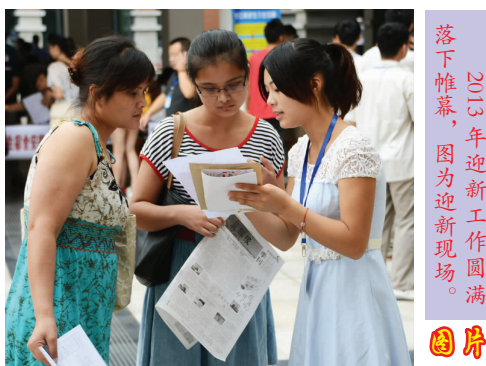
落下帷幕，图为迎新现场。

由教育部财经教学指导委员会主办的第九届全国职业院校“用友新道杯”沙盘模拟经营大赛全国总决赛在河南郑州举行。