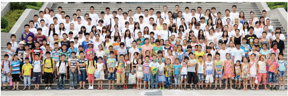
暑期“三下乡”合影留念